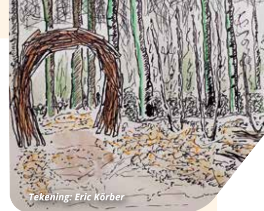
Tekening: Eric Körber

Bij de poort van het Vrouwenbos betreed je een gebied waarin Landart zichtbaar is. Door het gebruik van natuurlijke materialen wordt de geest geprikkeld tot kijken, luisteren en voelen. Je ziet sculpturen gemaakt door cliënten van GGzE. Een aantal objecten is te zien, andere zijn nog in de maak.